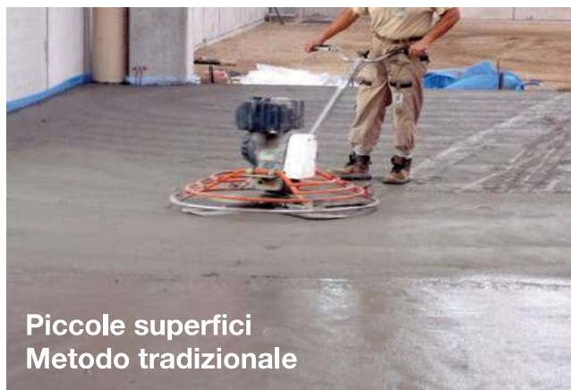
Piccole superfici Metodo tradizionale