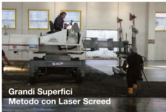
Grandi Superfici Metodo con Laser Screed

Le grandi aree di calcestruzzo dovrebbero essere gettate con l'utilizzo di laser screed. Per le aree più piccole è sufficiente utilizzare il metodo tradizionale con le fasce di livello.